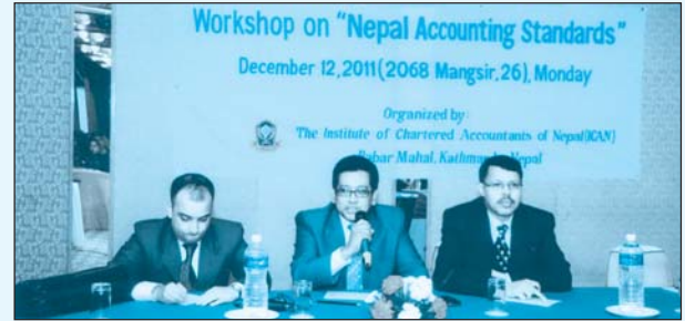
लेखामान सम्बन्धी कार्यशाला गोष्ठीको एक फलक ।

नेपाल चार्टर्ड एकाउन्टेन्ट्स संस्थाले मिति २०६८/०८/२६ गते होटल डेल अन्नपूर्णमा एक दिने कार्यशाला गोष्ठीको आयोजना गर्‍यो ।