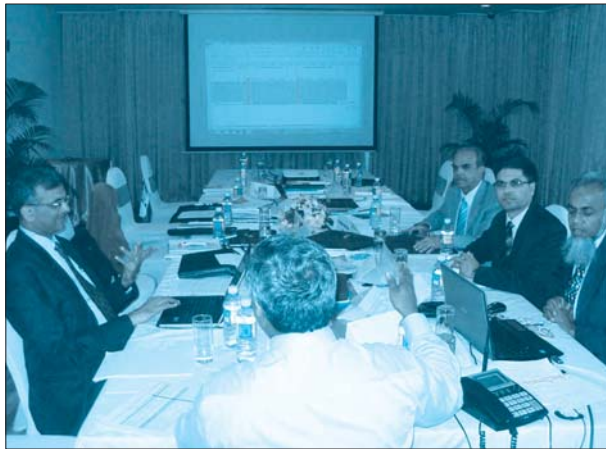
साफा ITAG कमिटी बैठकको एक दृश्य ।

श्रीलंकाको राजधानी कोलम्बोमा नोभेम्बर २/३, २०११ मा आयोजित SAFA ITAG कमिटीको बैठकले साफामा आबद्ध सार्क राष्ट्रका विभिन्न संगठनहरूका दश विधामा उत्कृष्ट वित्तीय प्रतिवेदन प्रस्तुतीकरण पुरस्कारको अन्तिम छनौट गर्‍यो ।