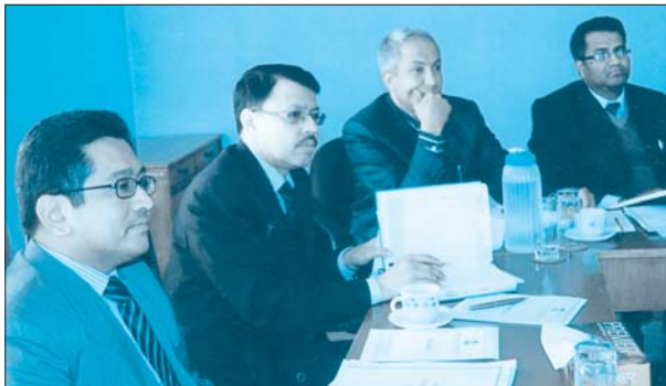
कार्यशाला गोष्ठीको एक फलक ।

संस्थाको बैठक कक्षमा विभिन्न निकायका प्रतिनिधिहरूको उपस्थितिमा एक कार्यशाला गोष्ठी सम्पन्न भयो ।